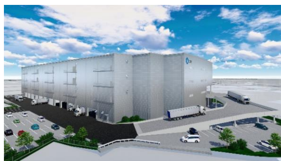
23 ロジスクエア枚方 2023年1月竣工予定