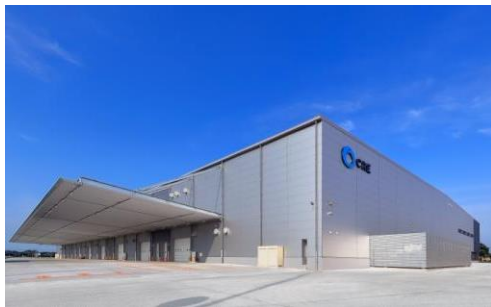
5 ロジスクエア羽生 2016年7月竣工