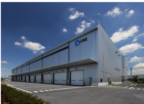
15 ロジスクエア川越Ⅱ 2019年6月竣工