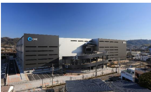
19 ロジスクエア大阪交野 2021年1月竣工