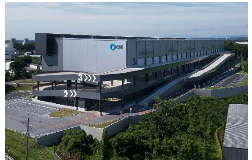
18 ロジスクエア狭山日高 2020年6月竣工