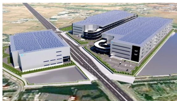
28-30 ロジスクエアふじみ野 (A棟・B棟・C棟) 2023年、2024年竣工予定