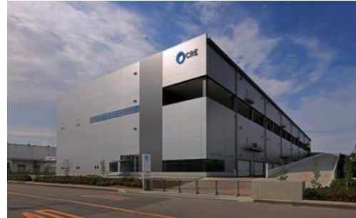
4 ロジスクエア久喜 2016年6月竣工