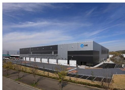
16 ロジスクエア神戸西 2020年4月竣工