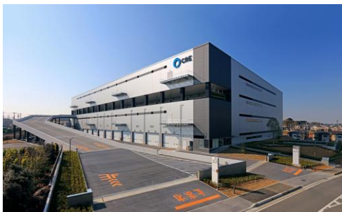
7 ロジスクエア浦和美園 2017年4月竣工