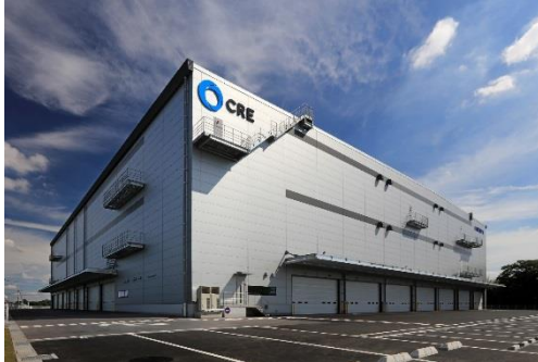
13 ロジスクエア春日部 2018年6月竣工