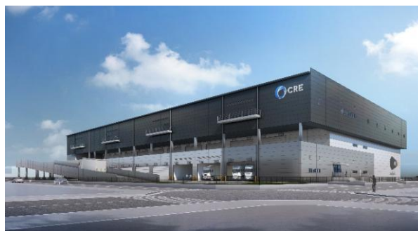
22 ロジスクエア白井 2022年12月竣工予定