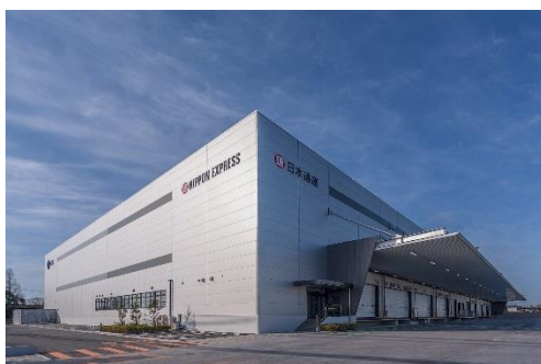
11 ロジスクエア鳥栖 2018年2月竣工