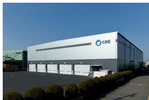
12 ロジスクエア川越 2018年2月竣工