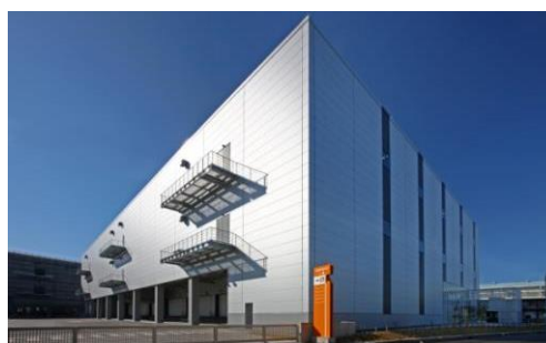
2 ロジスクエア八潮 2014年1月竣工