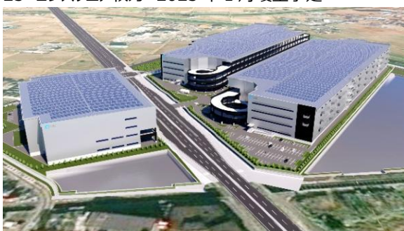
28-30 ロジスクエアふじみ野 (A棟・B棟・C棟) 2023年、2024年竣工予定