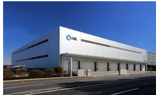
6 ロジスクエア久喜II 2017年2月竣工