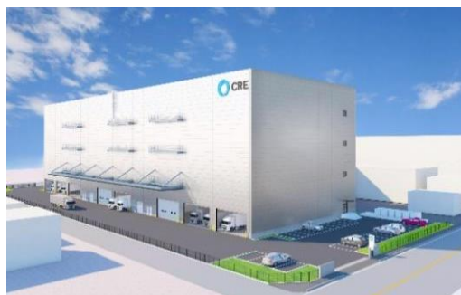
25 ロジスクエア松戸 2023年春頃竣工予定