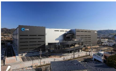
19 ロジスクエア大阪交野 2021年1月竣工