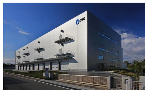
8 ロジスクエア新座 2017年4月竣工