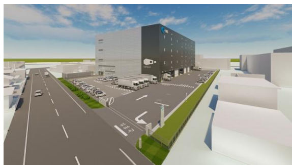
24 ロジスクエア厚木Ⅰ 2023年3月竣工予定