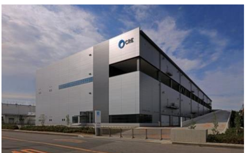
4 ロジスクエア久喜 2016年6月竣工