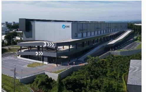
18 ロジスクエア狭山日高 2020年6月竣工