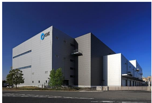
14 ロジスクエア上尾 2019年4月竣工