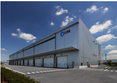
15 ロジスクエア川越Ⅱ 2019年6月竣工