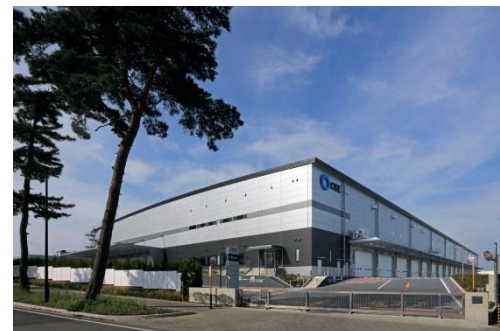
9 ロジスクエア守谷 2017年5月竣工