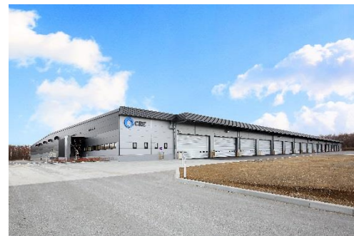
10 ロジスクエア千歳 2017年12月竣工