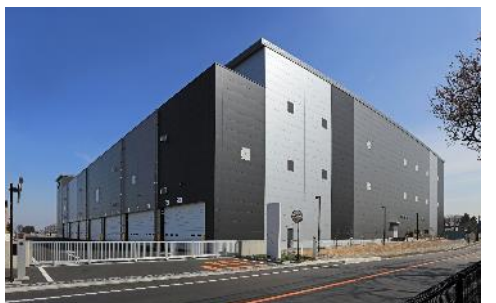
20 ロジスクエア三芳Ⅱ 2021年3月竣工