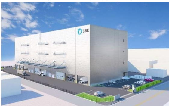
25 ロジスクエア松戸 2023年春頃竣工予定