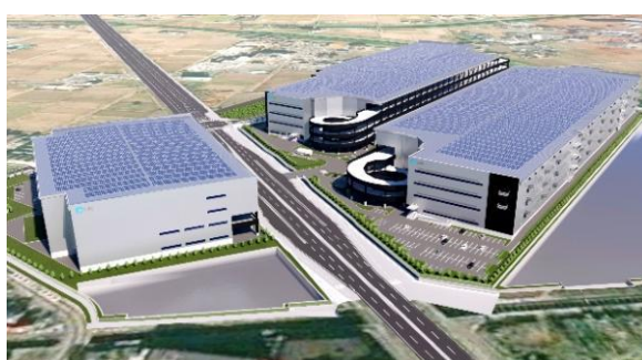
28-30 ロジスクエアふじみ野 (A棟・B棟・C棟) 2023年、2024年竣工予定