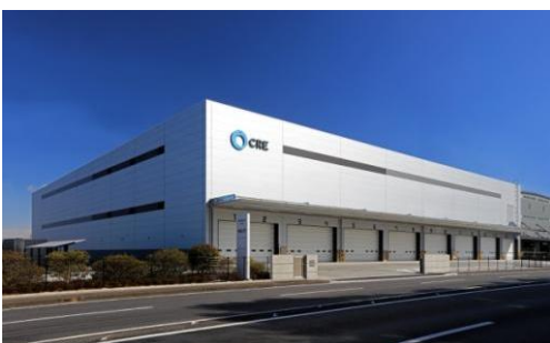
6 ロジスクエア久喜II 2017年2月竣工