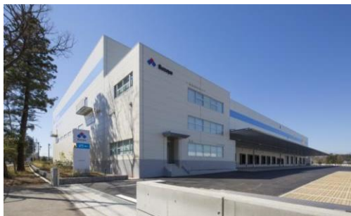
3 ロジスクエア日高 2015年3月竣工