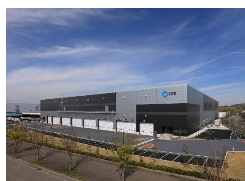
16 ロジスクエア神戸西 2020年4月竣工