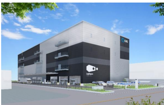
25 ロジスクエア松戸 2023年5月竣工予定