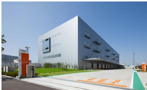
1 ロジスクエア草加 2013年6月竣工