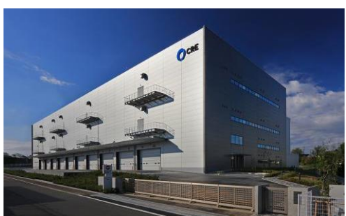
8 ロジスクエア新座 2017年4月竣工