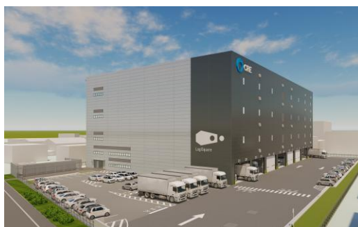
24 ロジスクエア厚木 I 2023年3月竣工予定