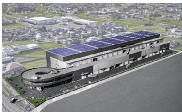
27 ロジスクエアアール宮 2023年秋頃竣工予定