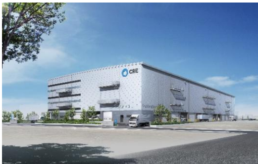
21 ロジスクエア伊丹 2022年11月竣工予定