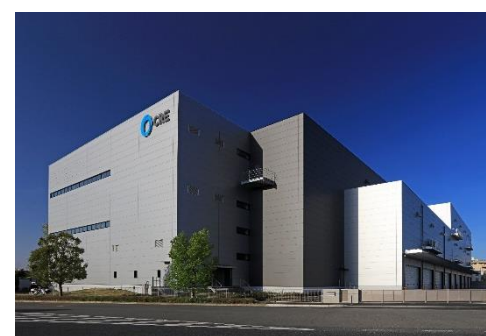
14 ロジスクエア上尾 2019年4月竣工