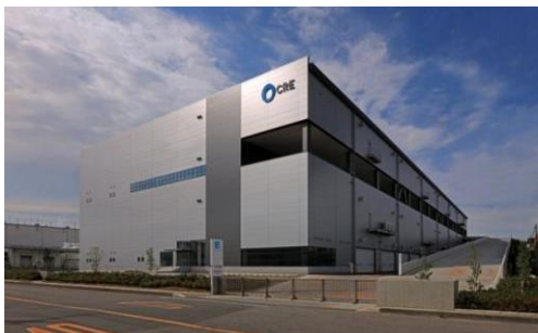
4 ロジスクエア久喜 2016年6月竣工