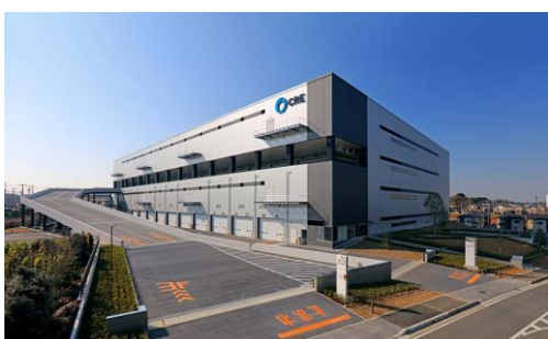
7 ロジスクエア浦和美園 2017年4月竣工