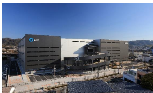
19 ロジスクエア大阪交野 2021年1月竣工