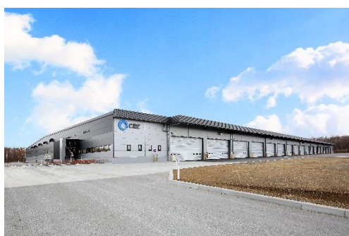
10 ロジスクエア千歳 2017年12月竣工