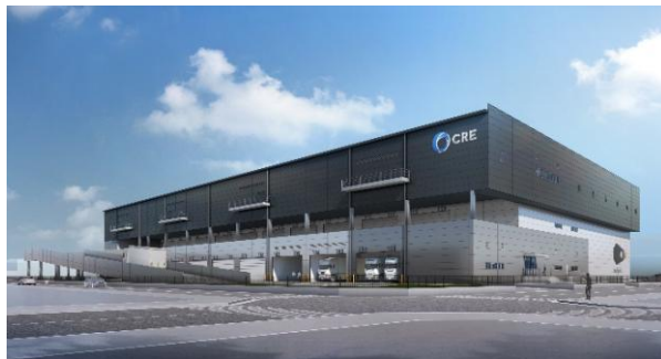
22 ロジスクエア白井 2022年12月竣工予定