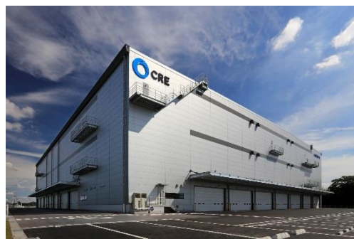
13 ロジスクエア春日部 2018年6月竣工