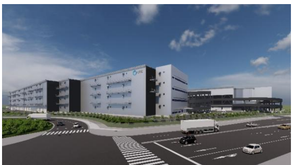
29-31 ロジスクエアふじみ野 (A棟・B棟) 2024年竣工予定