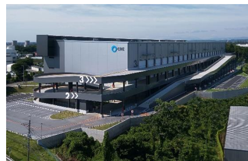
18 ロジスクエア狭山日高 2020年6月竣工