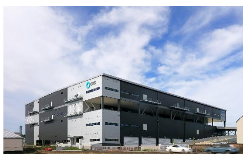
17 ロジスクエア三芳 2020年6月竣工