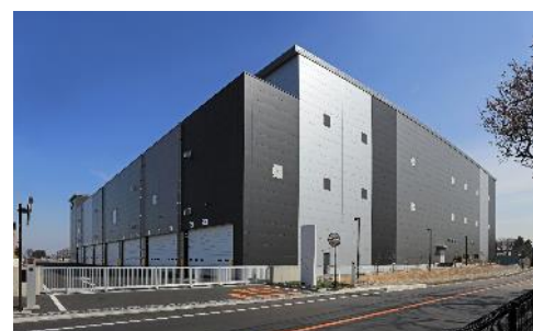
20 ロジスクエア三芳Ⅱ 2021年3月竣工