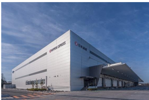
11 ロジスクエア鳥栖 2018年2月竣工