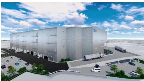
23 ロジスクエア枚方 2023年1月竣工予定