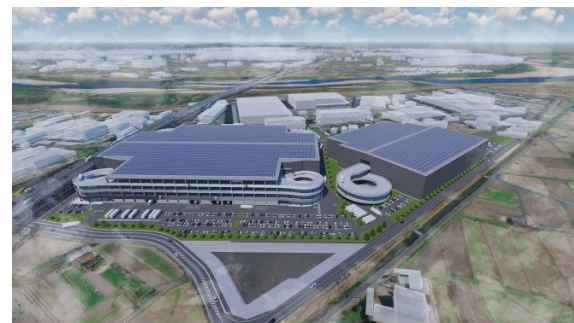
32 ロジスクエア京田辺 A 2025年2月竣工予定 33 ロジスクエア京田辺 B 2026年竣工予定