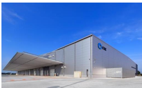
5 ロジスクエア羽生 2016年7月竣工