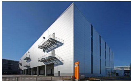
2 ロジスクエア八潮 2014年1月竣工