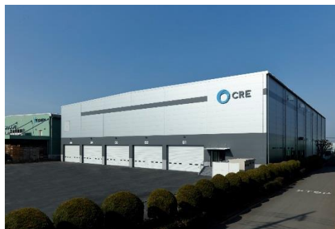
12 ロジスクエア川越 2018年2月竣工