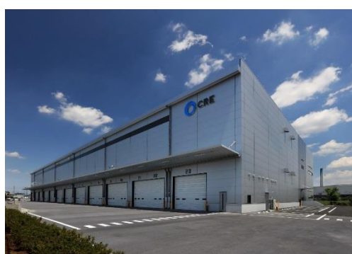
15 ロジスクエア川越Ⅱ 2019年6月竣工