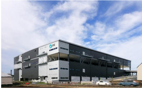
17 ロジスクエア三芳 2020年6月竣工