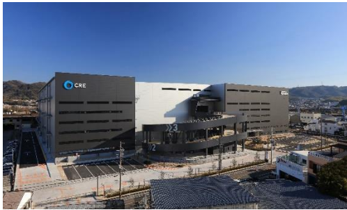
19 ロジスクエア大阪交野 2021年1月竣工