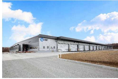
10 ロジスクエア千歳 2017年12月竣工