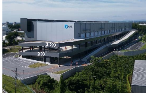
18 ロジスクエア狭山日高 2020年6月竣工