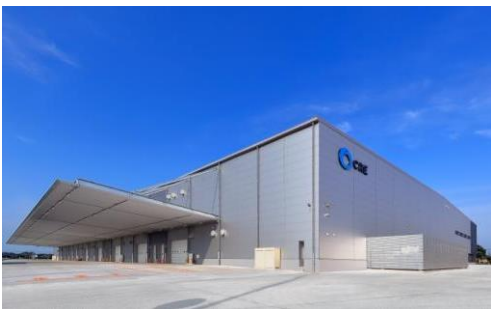
5 ロジスクエア羽生 2016年7月竣工