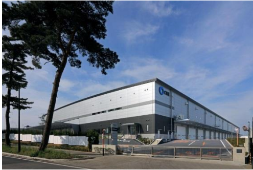
9 ロジスクエア守谷 2017年5月竣工