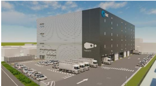
24 ロジスクエア厚木Ⅰ 2023年3月竣工予定