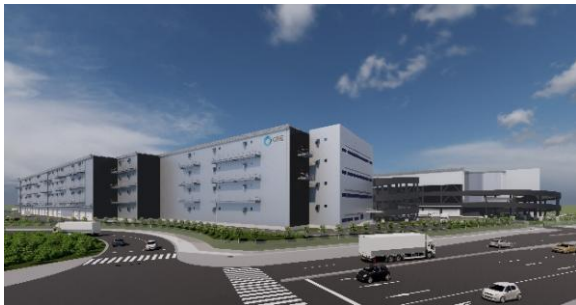
29 ロジスクエアふじみ野A 2024年1月竣工予定