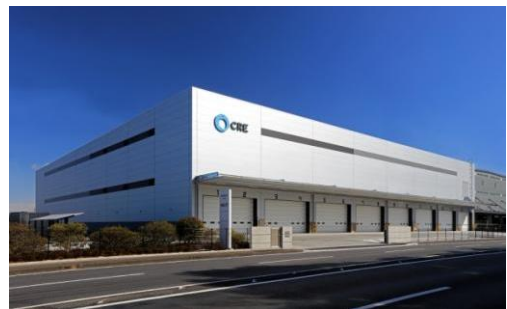
6 ロジスクエア久喜Ⅱ 2017年2月竣工