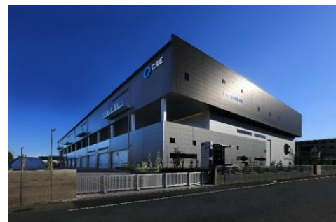
22 ロジスクエア白井 2022年12月竣工