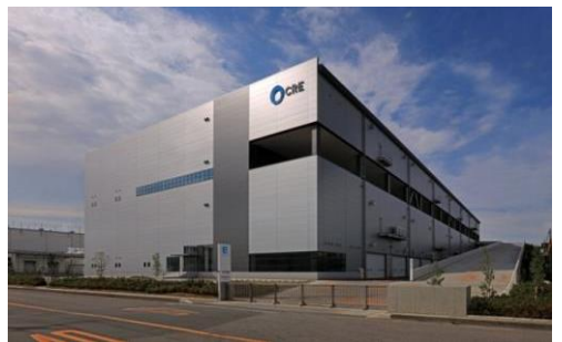
4 ロジスクエア久喜 2016年6月竣工