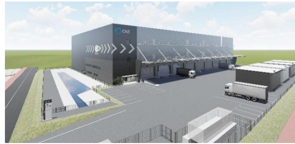
27 ロジスクエア福岡小郡 2024年2月竣工予定