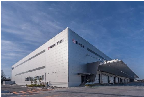
11 ロジスクエア鳥栖 2018年2月竣工