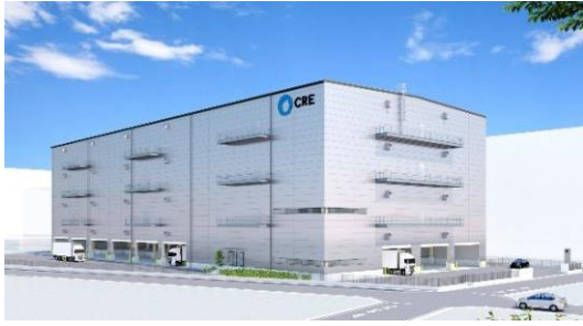
39 ロジスクエア草加Ⅱ 2024年8月竣工予定