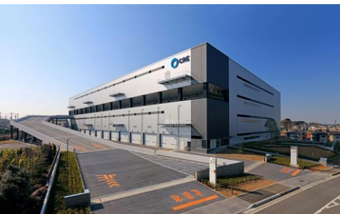
7 ロジスクエア浦和美園 2017年4月竣工