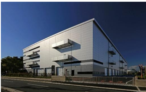
21 ロジスクエア伊丹 2022年11月竣工