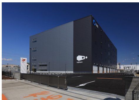
24 ロジスクエア厚木 I 2023年3月竣工