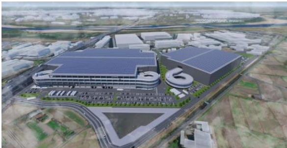
32 ロジスクエア京田辺 A 2025年2月竣工予定