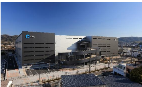
19 ロジスクエア大阪交野 2021年1月竣工