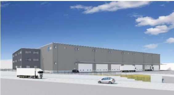
34 ロジスクエア掛川 2024年1月竣工予定