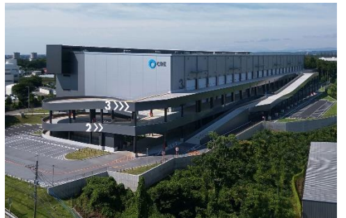
18 ロジスクエア狭山日高 2020年6月竣工