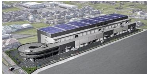
26 ロジスクエア一宮 2023年9月竣工予定