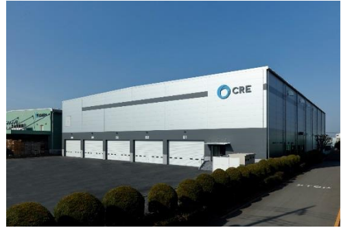
12 ロジスクエア川越 2018年2月竣工