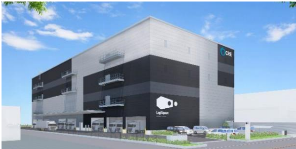
25 ロジスクエア松戸 2023年5月竣工予定