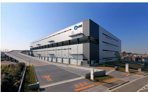
7 ロジスクエア浦和美園 2017年4月竣工