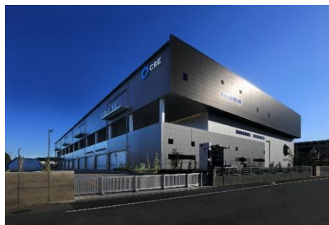
22 ロジスクエア白井 2022年12月竣工