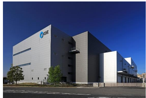
14 ロジスクエア上尾 2019年4月竣工