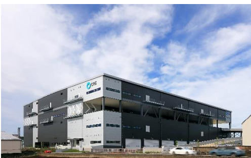
17 ロジスクエア三芳 2020年6月竣工