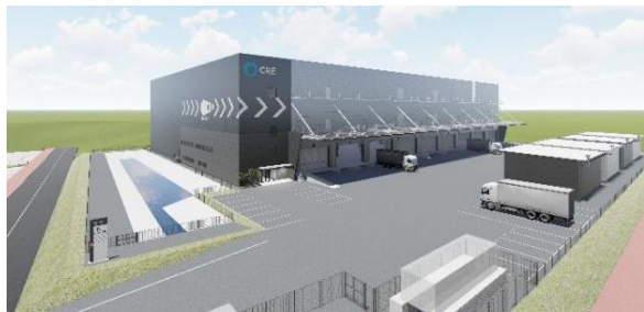
27 ロジスクエア福岡小郡 2024年2月竣工予定