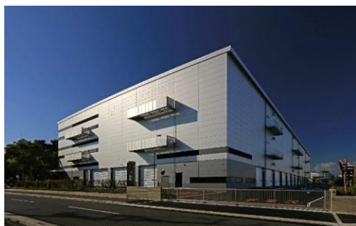
21 ロジスクエア伊丹 2022年11月竣工