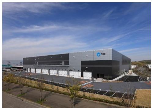
16 ロジスクエア神戸西 2020年4月竣工