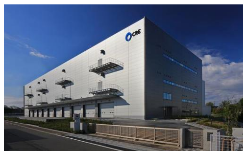
8 ロジスクエア新座 2017年4月竣工