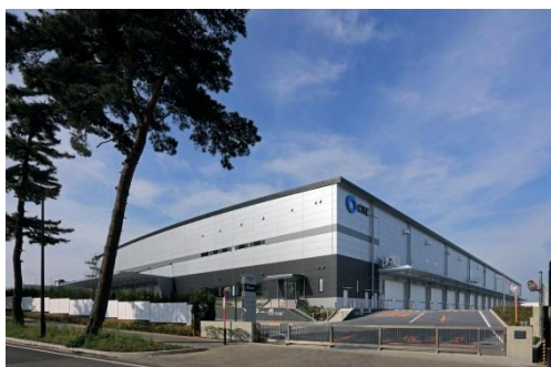
9 ロジスクエア守谷 2017年5月竣工