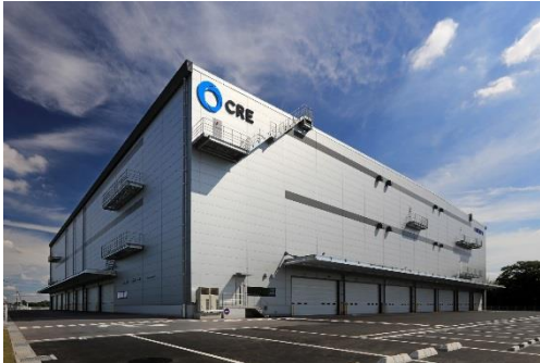
13 ロジスクエア春日部 2018年6月竣工