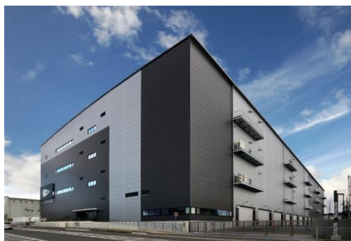
23 ロジスクエア枚方 2023年1月竣工