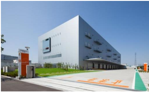
1 ロジスクエア草加 2013年6月竣工