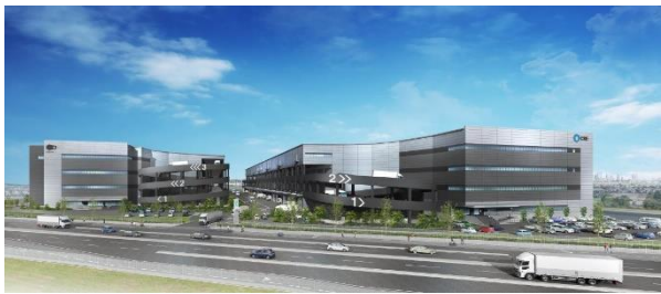
29 ロジスクエアふじみ野 A 2024年1月竣工予定