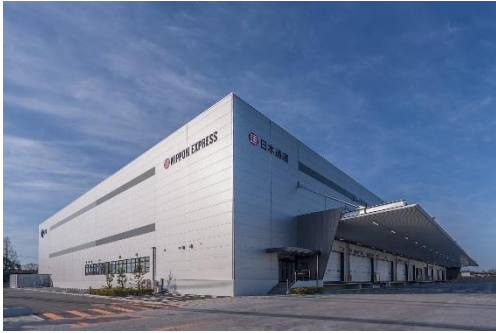
11 ロジスクエア鳥栖 2018年2月竣工