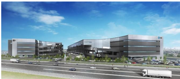
29 ロジスクエアふじみ野 A 2024年1月竣工予定 30 ロジスクエアふじみ野 B 2024年10月竣工予定