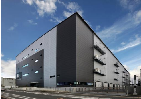
23 ロジスクエア枚方 2023年1月竣工