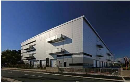
21 ロジスクエア伊丹 2022年11月竣工