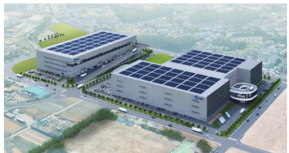
35 ロジスクエア朝霞 A 2026年竣工予定 36 ロジスクエア朝霞 B 2026年竣工予定 ※パースはイメージであり、今後変更となる可能性がございます。