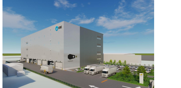
28 ロジスクエア厚木Ⅱ 2024年3月竣工予定