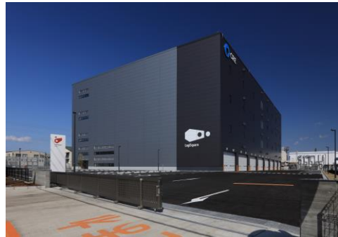
24 ロジスクエア厚木I 2023年3月竣工