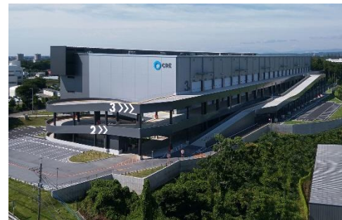
18 ロジスクエア狭山日高 2020年6月竣工