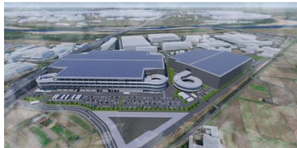
32 ロジスクエア京田辺 A 2025年2月竣工予定 33 ロジスクエア京田辺 B 2026年竣工予定