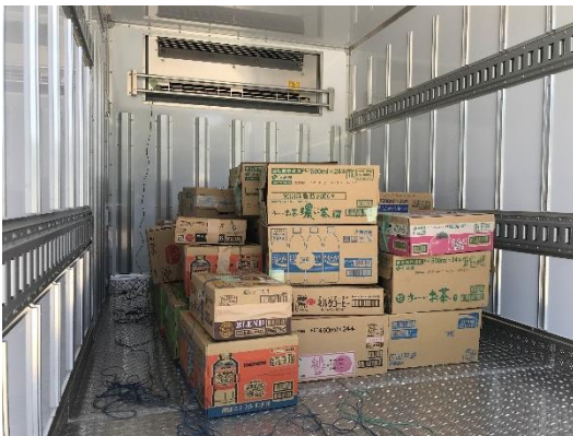
常温飲料の冷蔵計測試験の様子

近年、冷凍車は、従来の冷凍・冷蔵品の輸送だけでなく、災害時の緊急物資輸送や、イベント会場における冷蔵設備の代わりなど、様々な用途で活用されています。今回公開した温度試験結果は、冷凍車の冷蔵庫としての活用シーンにおいても、その有効性を示しました。