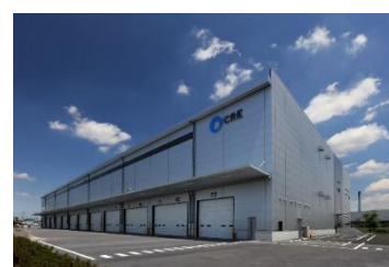
15 ロジスクエア川越II 2019年6月竣工