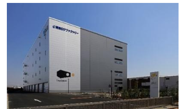
30 ロジスクエア厚木 II 2024年3月竣工