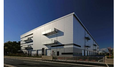
21 ロジスクエア伊丹 2022年11月竣工