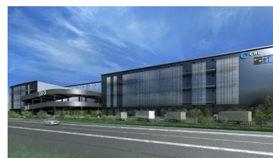
3 ロジスクエア朝霞 A 2027 年 5 月竣工予定