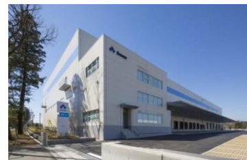
3 ロジスクエア日高 2015年3月竣工