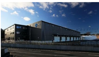
28 ロジスクエア掛川 2024年1月竣工