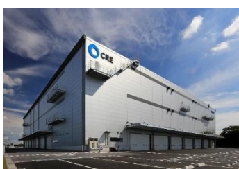
13 ロジスクエア春日部 2018年6月竣工