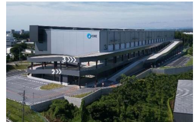
18 ロジスクエア狭山日高 2020年6月竣工