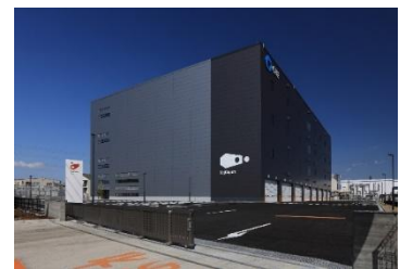
24 ロジスクエア厚木 I 2023年3月竣工