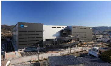
19 ロジスクエア大阪交野 2021年1月竣工