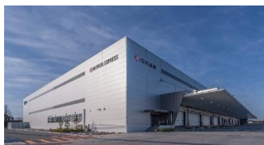
11 ロジスクエア鳥栖 2018年2月竣工