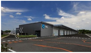
31 ロジスクエア成田 2024年5月竣工