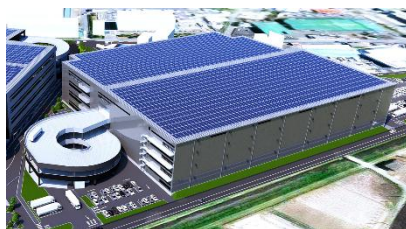
2 ロジスクエア京田辺 B 2026 年 8 月竣工予定