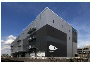
25 ロジスクエア松戸 2023年5月竣工