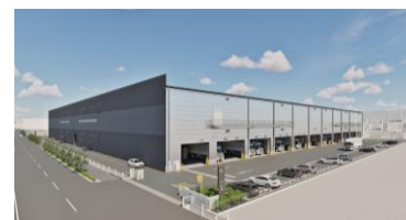
6 ロジスクエア鳥栖Ⅱ 2026 年 9 月竣工予定