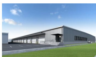
10 (仮称) LOGIWITH・LogiSquare 明石 2027 年 8 月竣工予定