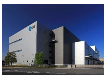
14 ロジスクエア上尾 2019年4月竣工