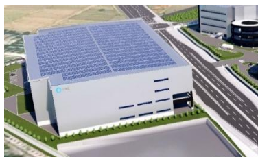
1 ロジスクエアふじみ野 C 竣工時期未定