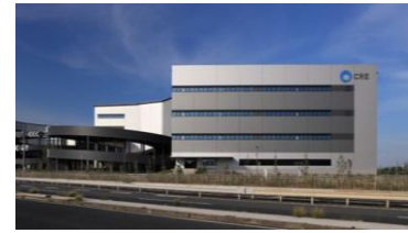
33 ロジスクエアふじみ野 B 2024年10月竣工