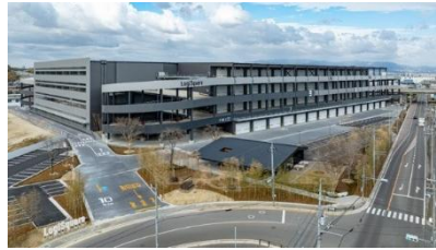
35 ロジスクエア京田辺 A 2025年2月竣工