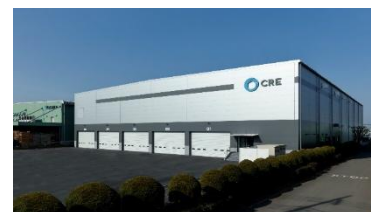
12 ロジスクエア川越 2018年2月竣工