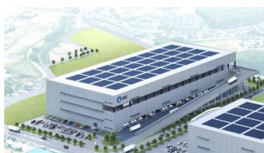
4 ロジスクエア朝霞 B 2028 年 2 月竣工予定