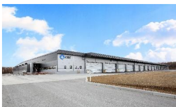
10 ロジスクエア千歳 2017年12月竣工