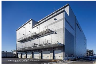
37 ロジスクエア厚木南 2026年1月竣工