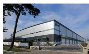
9 ロジスクエア守谷 2017年5月竣工