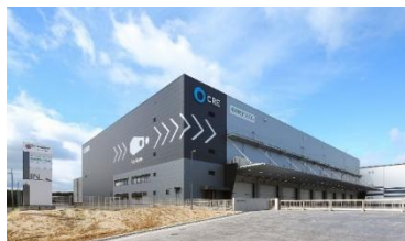
29 ロジスクエア福岡小郡 2024年2月竣工