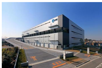
7 ロジスクエア浦和美園 2017年4月竣工