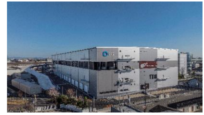
36 ロジスクエア名古屋みなと 2025年12月竣工