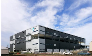
17 ロジスクエア三芳 2020年6月竣工