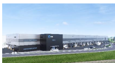
8 ロジスクエア鳥栖Ⅲ 2027 年 4 月竣工予定