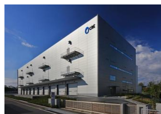
8 ロジスクエア新座 2017年4月竣工