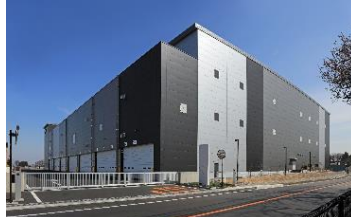
20 ロジスクエア三芳 II 2021年3月竣工