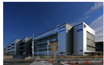
27 ロジスクエアふじみ野 A 2024年1月竣工