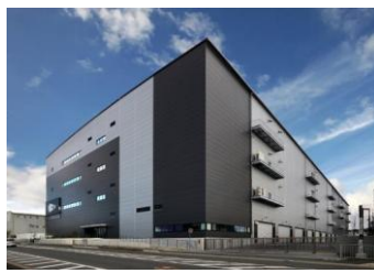
23 ロジスクエア枚方 2023年1月竣工