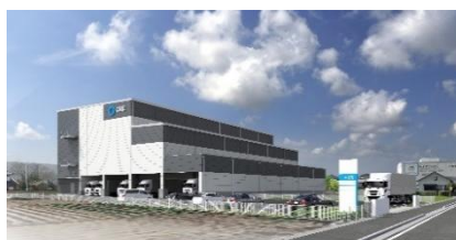
5 ロジスクエア久喜Ⅲ 竣工時期未定