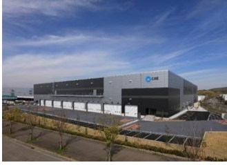
16 ロジスクエア神戸西 2020年4月竣工