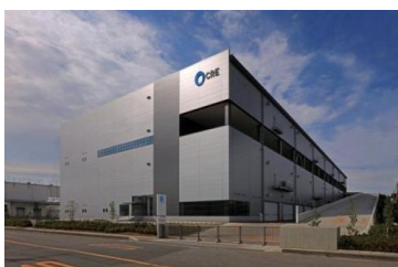
4 ロジスクエア久喜 2016年6月竣工