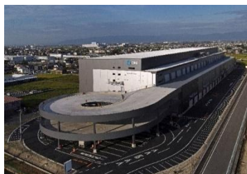
26 ロジスクエアア宮 2023年9月竣工