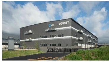
32 ロジシティ小郡 2024年7月竣工