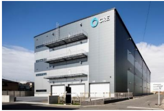
34 ロジスクエア草加Ⅱ 2024年10月竣工