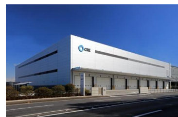
6 ロジスクエア久喜II 2017年2月竣工